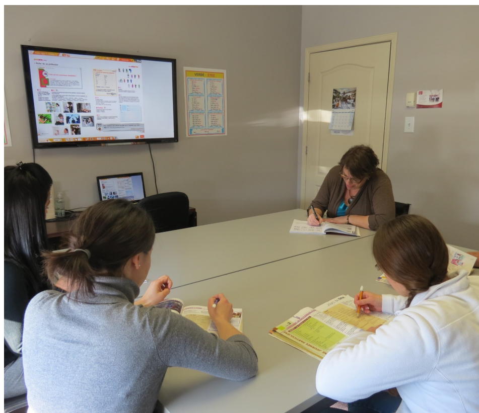
Nos groupes à Brossard

CPMT: Commission des Partenaires du Marché du Travail aux fins de l'application de la Loi favorisant le développement et la reconnaissance des compétences de la main-d'œuvre.